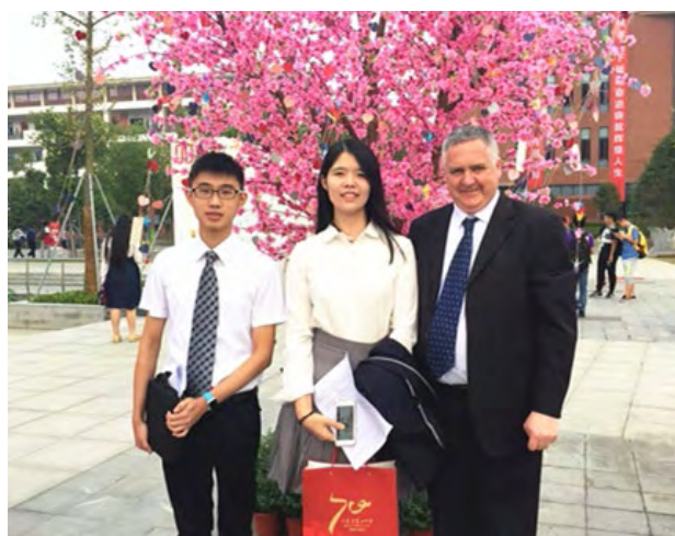
昆中 70 周年校庆志愿者翻译