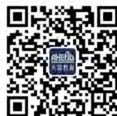
美国留学规划部微信公众号