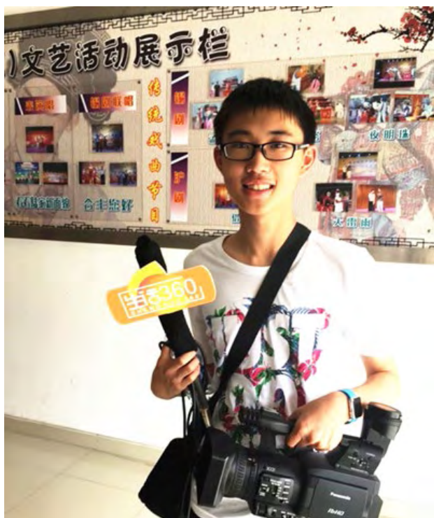
昆山电视台实习记者